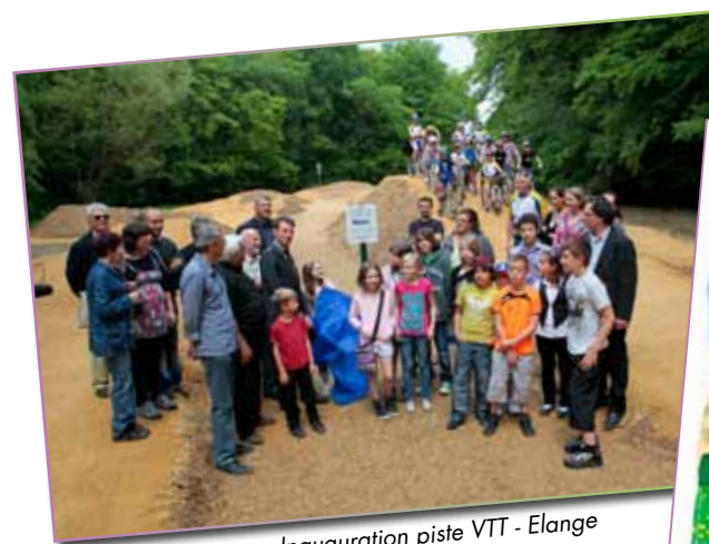
Inauguration piste VTT - Elange