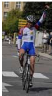
Etape Thionville - Jarny.

DÉPART OFFICIEL DU CIRCUIT DE LORRAINE CYCLISTE PROFESSIONNEL MERCREDI 19 MAI PLACE DE LA LIBERTÉ