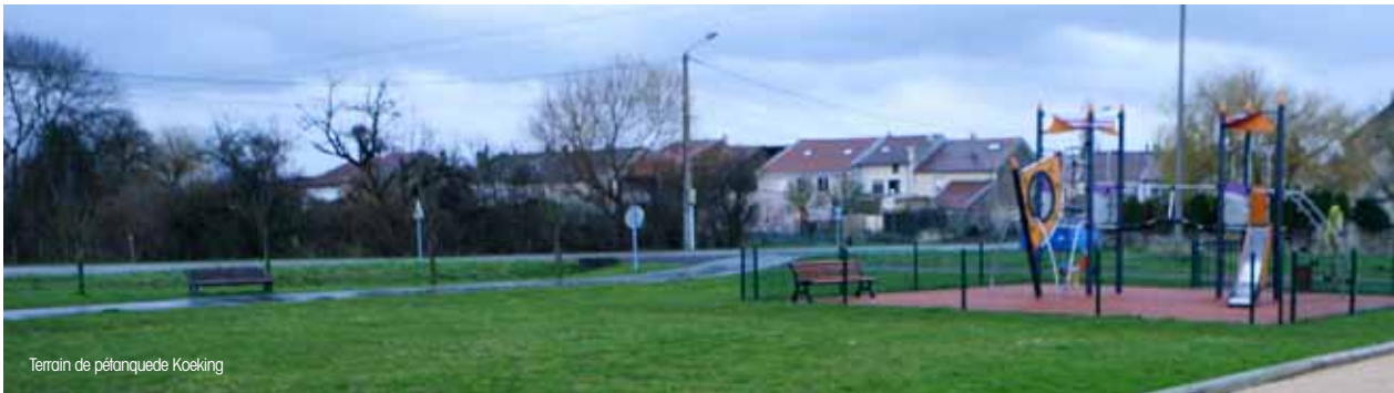
Terrain de pétanque de Koeking