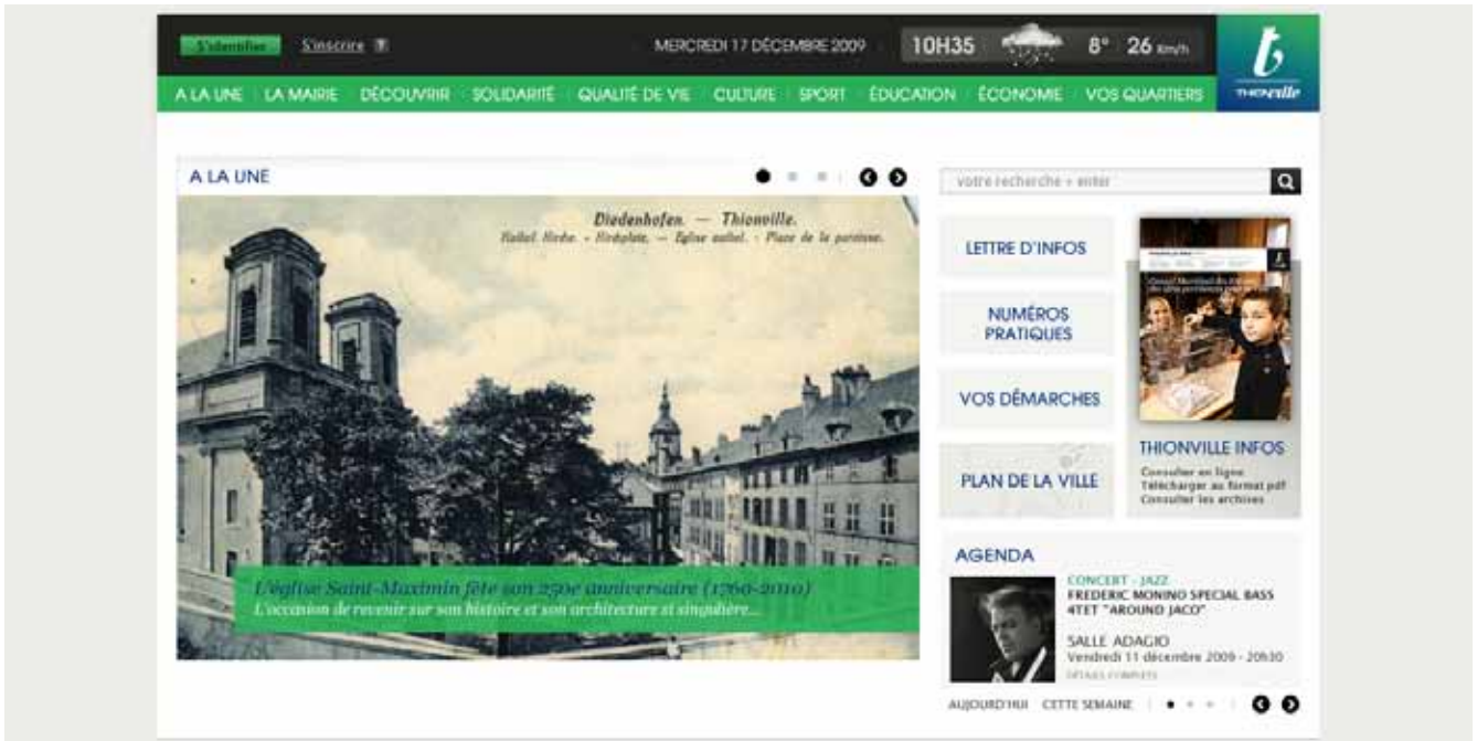
www.thionville.fr accessible à partir du 15 janvier 2010