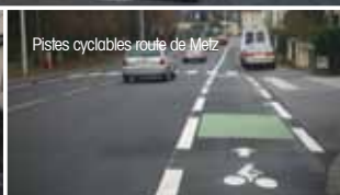
Pistes cyclables route de Metz