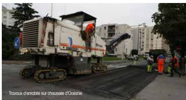
Travaux d'enrobés sur chaussée d'Océanie

Attention, faute d'entretien des trottoirs, votre responsabilité est engagée en cas d'accident devant chez vous, comme la chute d'un piéton, car les mesures de sauvegarde nécessaires n'auront pas été prises.