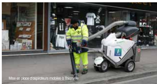
Mise en place d'aspirateurs mobiles à Thionville