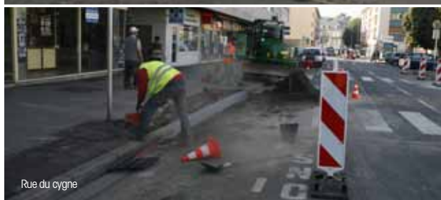
Rue du cygne