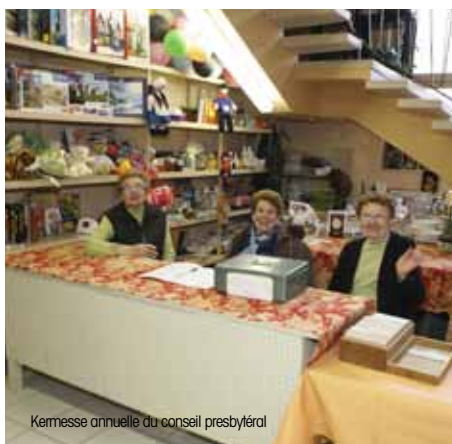
Kermesse annuelle du conseil presbytéral