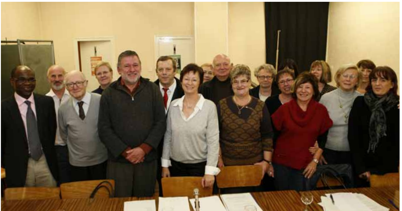
Composition du Conseil d'Administration de l'Association « Les P'tits Loups »

Aussi, le C.C.A.S. n'est pas seulement un financeur du monde associatif - même si ses aides sont importantes en la matière ( ndlr ,