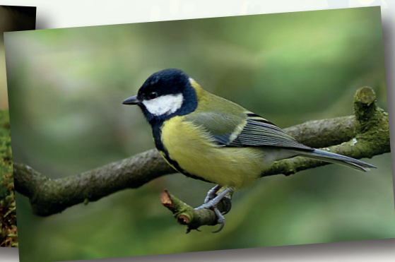
Diamètre du trou pour mésange charbonnière 32 mm