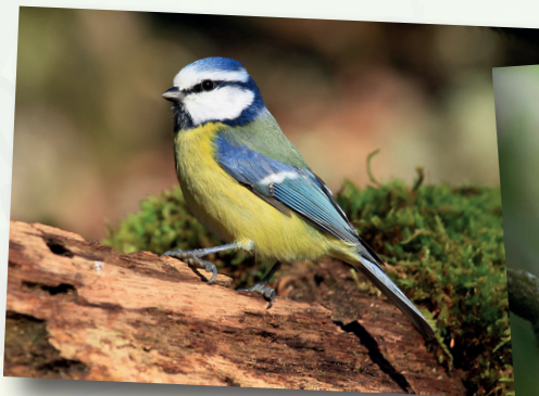
Diamètre du trou pour mésange bleue 28 mm