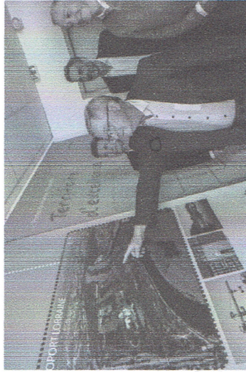
Au carrefour de la voie fluviale, du rail et des axes routiers, l'Europort ferme un premier investisseur crédible.

Par C. F. - 18 oct. 2021 à 19:42 | mis à jour le 18 oct. 2021 à 21:55 - Temps de lecture : 1 min